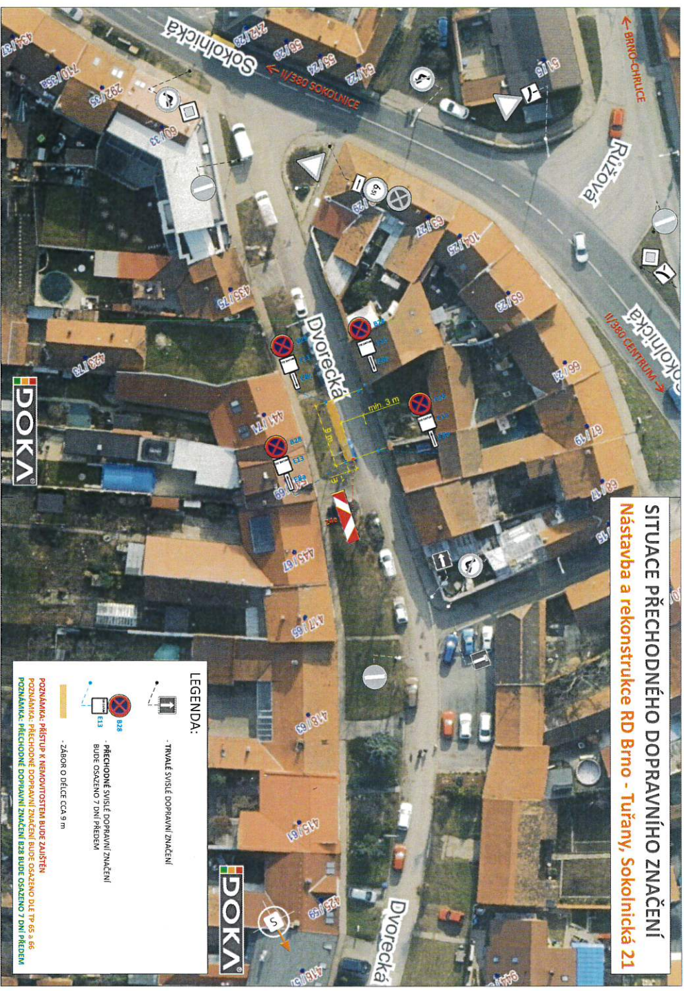
SITUACE PŘECHODNÉHO DOPRAVNÍHO ZNAČENÍ Nástavba a rekonstrukce RD Brno - Tuřany, Sokolnická 21