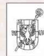
Znak opata Petra Silaveckého. Nese berlu (odznak opatské hodnosti), moravskou orlici a dvě skupiny písmen: písmena PSAV značí Petr Silavecký Abbas Velehradensis, písmena MORS značí MORmonduS, tj. filiaci (původ osazení kláštera).

Jeho Mlost Petr Silavecký, O.Cist. Údaje o datu a místu jeho narození nejsou známy. Byl moravský cisterciácký mnich. Velehradským opatem byl zvolen 21. července 1672. Po zničujícím požáru kláštera v roce 1681 zahájil v následujícím roku nejen zásadní přestavbu celého areálu opatství, ale i výstavbu zámku v Nenovicích, která byla dokončena v roce 1686. Zemřel 31. srpna 1691 a byl pohřben na Velehradě.