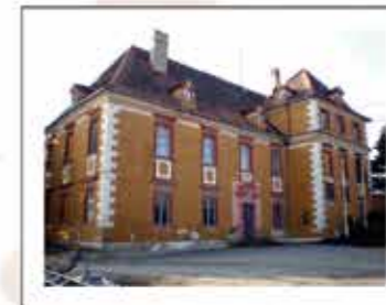
Budova raně barokního zámku byla dokončena v roce 1686 za opata Petra Silaveckého.

Na místě tvrze vybudován raně barokní zámek (místními občany nazýván Zámeček) patrně podle projektu císařského architekta Giovanni Pietro Tencally (1629–1702). Zámek sloužil jako rezidence velehradských opatů v blízkosti zemské hlavního města.