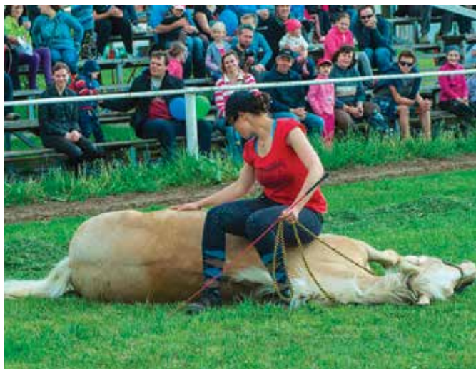
Spirit, ukázka drezúry koně

Dne 23. dubna 2016 se opět otevřely brány dostihového závodiště v Brně-Dvorskách a konal se zde první letošní dostihový den. Návštěvníci mohli sázet na koně, a to jako již tradičně v 8 dostizích - 5 rovinových a 3 dostizích přes překážky. K vidění byl i dostih pro neregistrované koně a závod pro děti a jejich poníky. Před velmi početnou diváckou návštěvou a na výborně připravené dostihové dráze se běžel i vrchol celého odpoledne – steeplechase o Pohár hejtmana Jihomoravského kraje o 80 000 Kč na 4100 metrů, který se konal pod záštitou hejtmana Michala Haška. Pozornost všech přitahoval zejména, po dopingovém skandálu zvíťevší kůň ve Velké pardubické Ribelino z dostihové stáje Lokotrans, trenéra Stanislava Kováře. Pro Ribelina měl být tento dostih vstupem do sezóny a přípravou na I. kvalifikaci do Velké pardubické steeplechase. Nicméně se ukázalo, že tento tah nebyl šťastně zvoleným. Snad to byly parametry závodiště, které koni příliš neseděly, snad se za tím schovávalo něco jiného. Nicméně Ribelino byl po zhruba dvou třetinách kurzu z posledního místa zadržen a dostih nedokončil. Tím pohasly všechny naděje sázejících, kteří doufali ve vítězství jasného kurzového favorita dostihu. Z osmi startujících