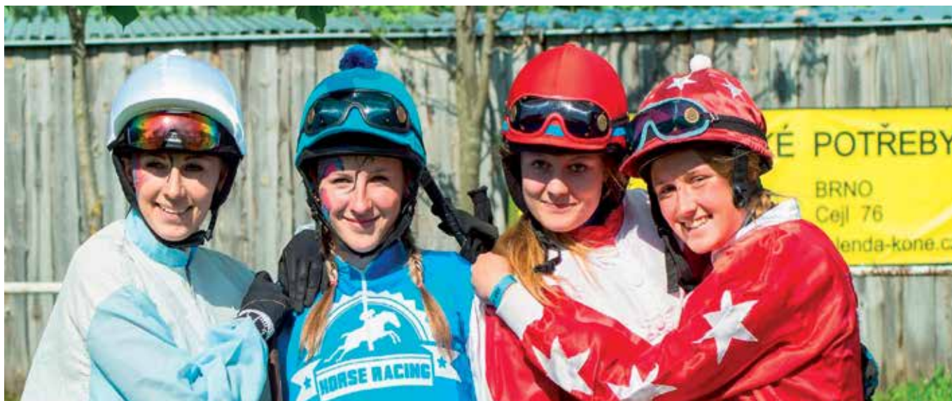
Košské hry 2016, jezdkyňe před startem