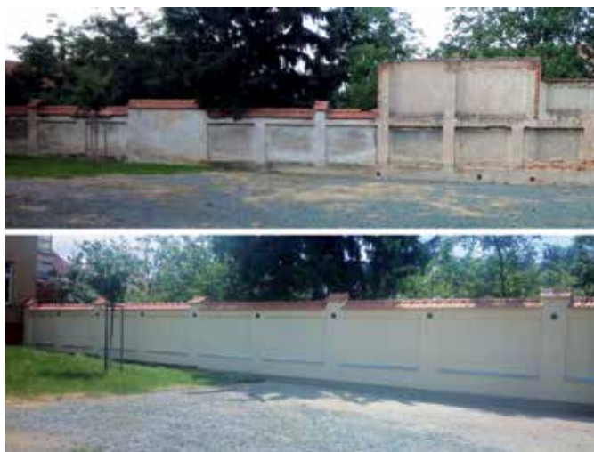
Opravená zeď ve dvoře radnice