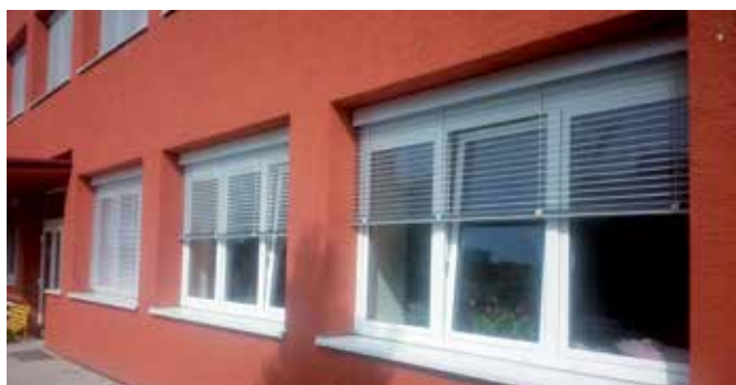
Nové žaluzie v MŠ Holásecká

Rád bych také zmínil dva důležité body, které se naší městské části dotýkají. Rada města Brna schválila „memorandum o obchvatu Tuřan“. Toto memorandum je důležitým krokem k vlastní realizaci obchvatu. V době uzávěrky ještě chybělo schválení od Zastupitelstva městské části Brno-Tuřany a Rady Jihomoravského kraje. Rada města Brna také schválila investiční záměr na revitalizaci Holáseckých jezer. Doufám, že tak nastane obrat v těchto palčivých tématech naší městské části.