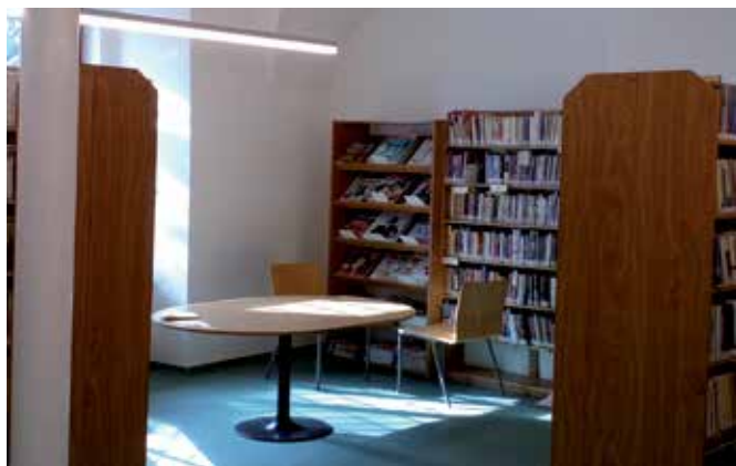
Konečná podoba knihovny

Poprvé se také letos pouštíme do oprav polních cest. V první fázi bude opravena cesta za školou směrem ke Slatině, polní cesta při ulici Heřmánkové a Režné a následovat budou i další.