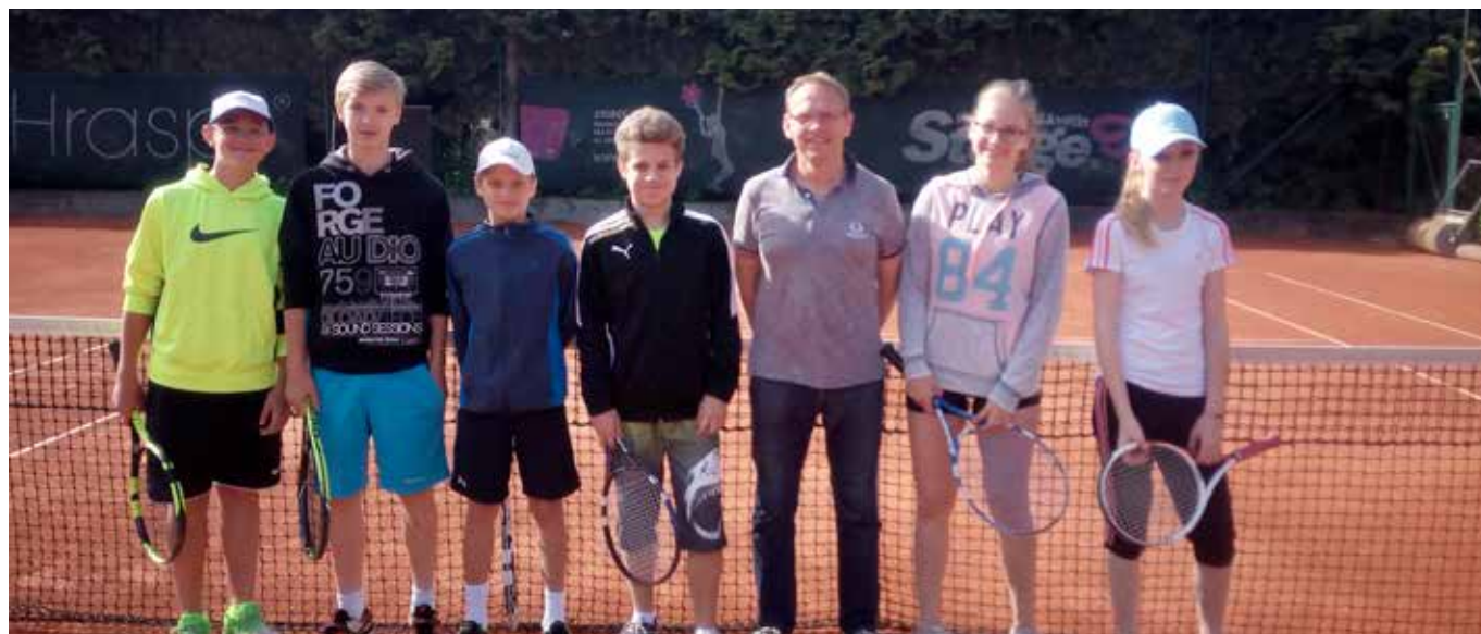
Družstvo dorostu TK Tuřany

Mírným zklamáním jsou zatím letošní výsledky starších a mladších žáků. Starší žáci zatím dokázali zvítězit pouze v jediném zápase a družstvo mladších žáků je na tom bohužel ještě o něco hůře, když nedokázalo zvítězit ani jednou. Ve zbytku sezóny tedy doufáme, že si tato družstva připsají ještě nějaká vítězství a neskončila ve svých soutěžích na posledních místech. V každém případě hráči a hráčky nasbírají